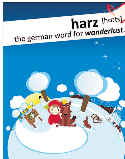
Die preisgekrönte Harz-Kampagne von hc media.